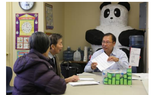
(Welfare benefits Information, 社會福利諮詢)